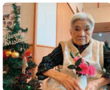
クリスマスツリーと一緒に