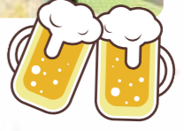
マジックにダンス♪大盛り上がりでした