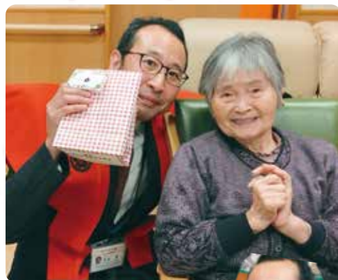
プレゼントが当たったよ

クリスマス忘年会が開催されたくさんの笑い声が聞こえ盛り上がりました。今年もたくさん笑っていきましょう。