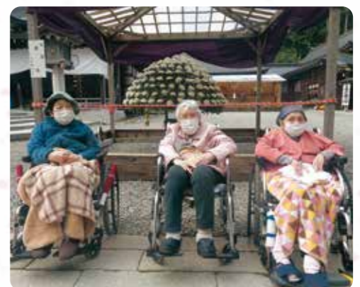
毎年恒例の菊祭りへ外出しました