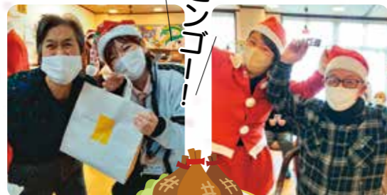
みんなでサンタに変身しました