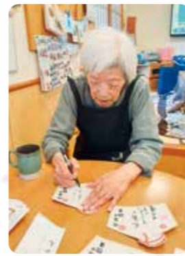
お正月に新年の目標を立てたりおせちを堪能しました！