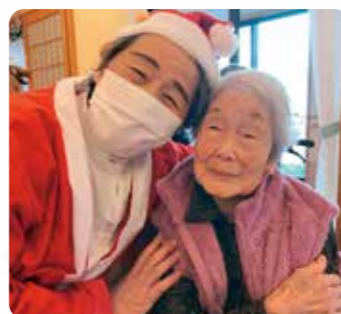
サンタさんと記念撮影