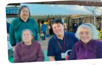
道の駅までドライブに行きました