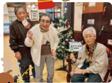
クリスマスツリーの飾りつけ、きれいにできました