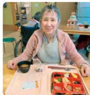
元旦におせちを食べました