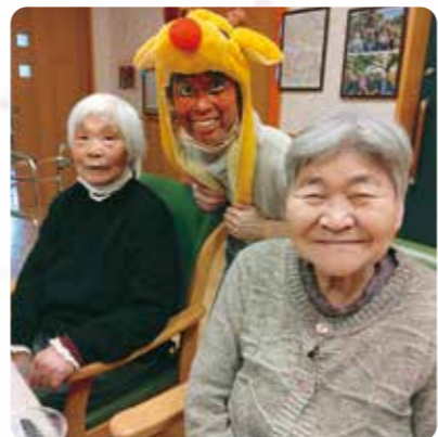
クリスマス楽しいね