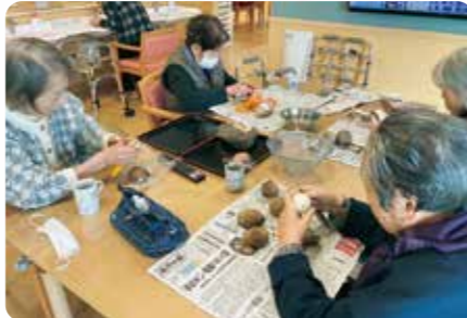
のっぺ作りをしました