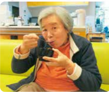
お汁粉を食べました