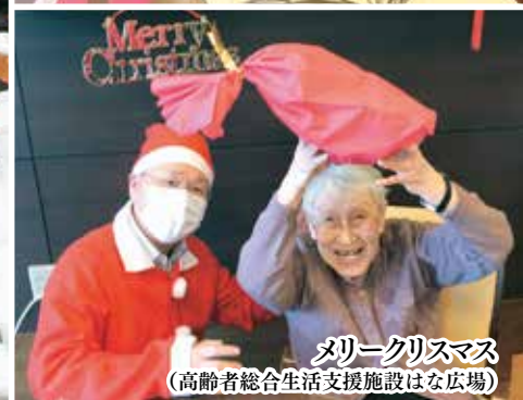
メリークリスマス (高齢者総合生活支援施設はな広場)

新しい年を迎えました。法人役職員一同、皆様の日頃からの変わらぬご支援に心からお礼申し上げます。本年もよろしくお願ひいたします。 昨年は1月1日に能登半島地震があり、桜井の里福祉会の職員は1月3日から7月までの間、現地の介護施設ご利用者と職員の支援に伺いました。大勢の方が甚大な被害を受け、亡くなった方々、今現在も復興に向けてご苦労されている方々のことを忘れずに、私たちが出来る支援活動を今後も行っていきたいと思います。 本年、令和7(2025)年は昭和から数えて100年、昭和20(1945)年の終戦から80年の節目になります。少々乱暴な分類になりますが、昭和前半の20年は戦争の時代、その後10年は復興の時代、後半の30年余りは高度経済成長と豊かさを実感した時代になるのではないのでしょうか。昭和前半を生き延びてこられた皆さまは、戦争の大変な苦労を経験し、家族や大切な人を亡くされた人、経済的基盤を失った人、人生の大切な時期を含めかけがえのないものを失った人などが大勢いられました。そして終戦後の廃墟から家族、地域などを守り懸命に今日までの繁栄を築いてこられました。皆さんの努力で、日本は80年間戦争がなく平和が続ぎ、健康保険、介護保険など社会保障制度などが整ったことを言っても、現在は「自らが持つて生まれた寿命を全うできる社会」で、世界で一番の長寿国になりました。昭和の時代から生きてこられた皆さんが、実感として「長生きしてよかった、幸せだ」と感じ思っていたらどうでしょう、私たち桜井の里福祉会は弥彦村、燕市、新潟市で今以上の良いケアを提供し続け、皆さまの安心感の一助になれるよう努力していきたいと考えています。