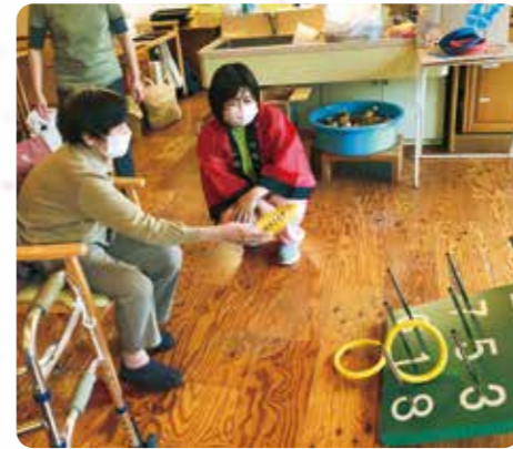
ひろば祭りで輪投げをしました