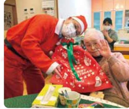
サンタがやってきました