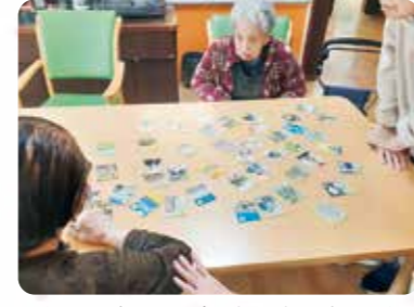
お正月と言えば、かるた取りです