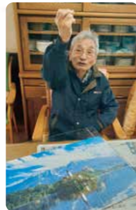
元旦にパズル完成