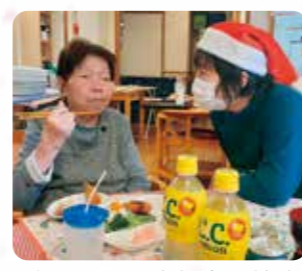
クリスマス忘年会、美味しい料理やプレゼント楽しんで頂けましたか？

クリスマスにはご家族をお招きし、一緒にごちそうを食べました。今年はお汁粉やおせち料理を食べたりとお正月を楽しむことができました。