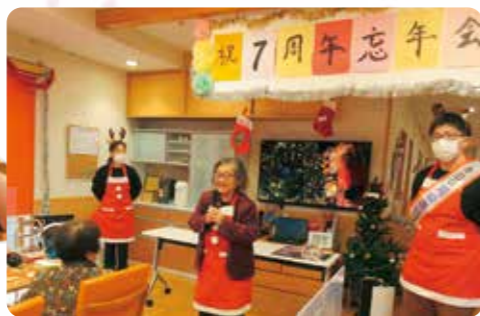
周年祭を始めます