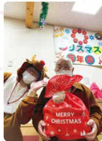
クリスマスプレゼントは何かな？