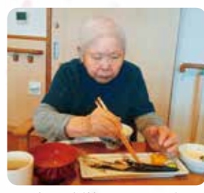
秋の味覚のサンマ♪美味しかったです