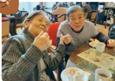
美味しいケーキいただきます