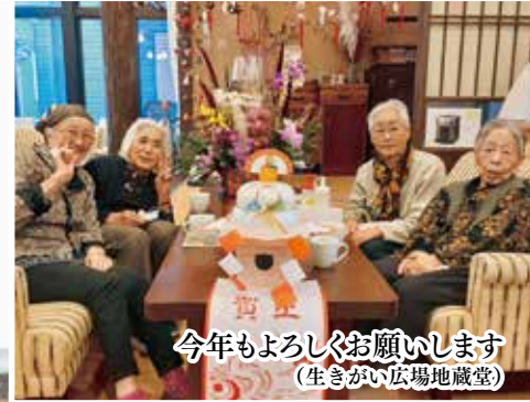
今年もよろしくお願ひします (生きがい広場地蔵堂)