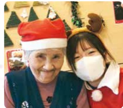
かわいいトナカイも来ましたよ