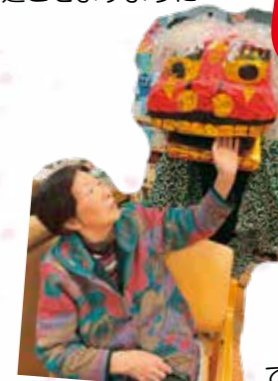
でっかい獅子舞だ