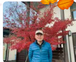
つどいの紅葉も綺麗に色づきました