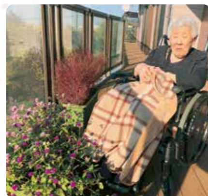
プランターのお花も綺麗ですね