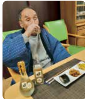
お正月用のお酒とおせち