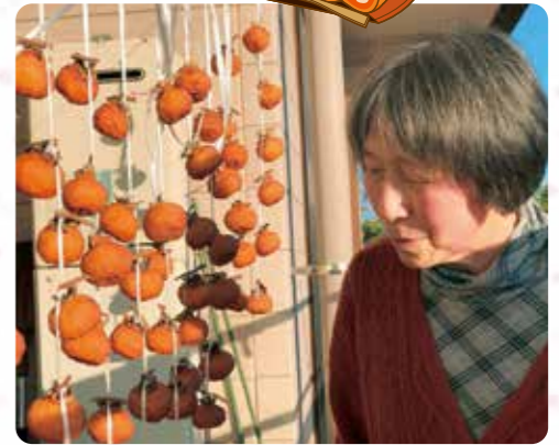
干し柿は、いい感じに干しあげりました