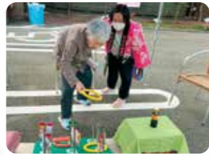
縁祭り、皆様に出し物を楽しんで頂きました！！