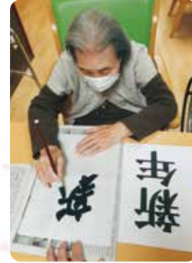
新年の書き初めをしました