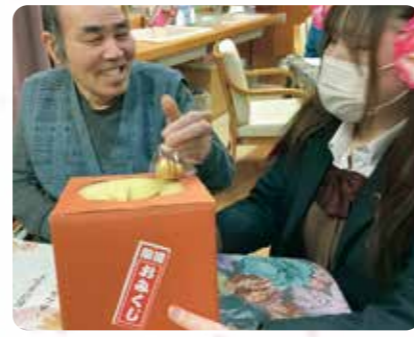
干支のおみくじ！何が出るかな？

明けましておめでとうございます。昨年はクリスマス忘年会を行い、皆さんにとっても喜んでいただきました。新年には願い事を書かれたり、福笑いをさ れ楽しまれておられました。