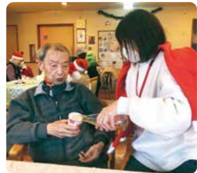
一緒に乾杯しましょう