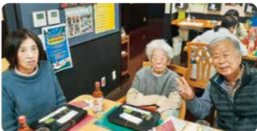
ご家族と一緒にだと自然と笑みがこぼれますね