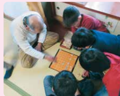
施設を一般開放し、地域の皆様にご利用頂いている様子です。