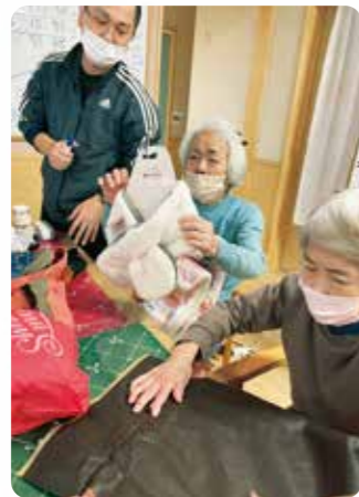
クリスマス忘年会、大勢でにぎやかでした