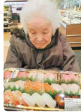
大晦日の昼食の買い物