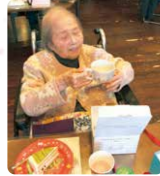
プレゼントを頂きました