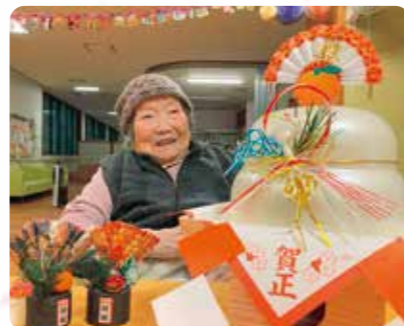
鏡餅を飾りました