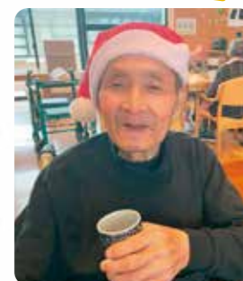
たくさん食べて満腹