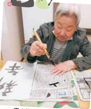
書き初めをしました！