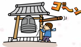
大晦日に神社にお参りに行ってきました