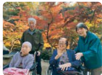
弥彦の紅葉谷・菊祭りは絶景でした