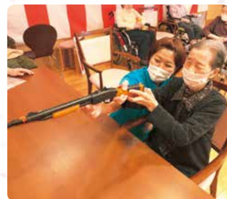
一緒に射的を楽しみました