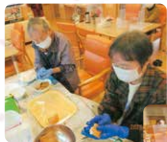
おいなりさんを作りました。 美味くなーれ