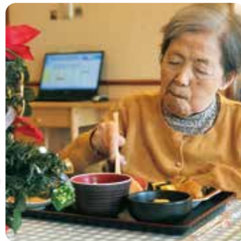
お寿司とってもおいしいね