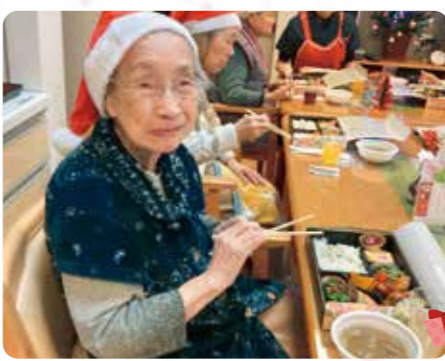
皆で食べるとおいしいね