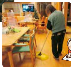
年末掃除しました