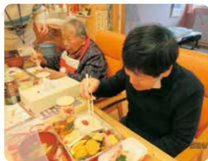
美味しいお弁当をいただきます