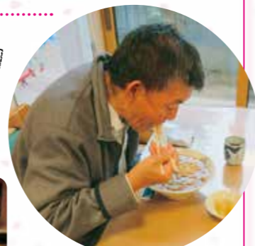
出前でラーメンを注文しました