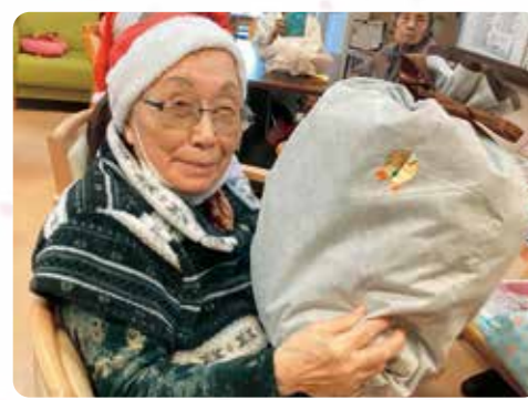
プレゼントもらったよ