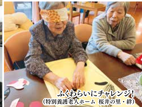
ふくわらいにチャレンジ! (特別養護老人ホーム 桜井の里・絆)