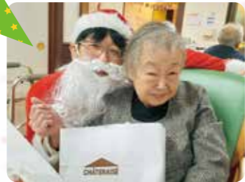
サンタさんからクリスマスプレゼント♪ 何が入ってるんだろう？