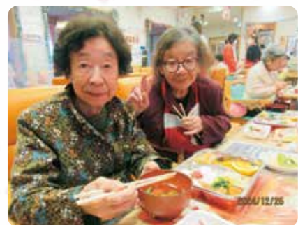
美味しいお料理でおなかいっぱい