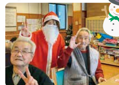
ご家族と一緒にクリスマス会を楽しみました