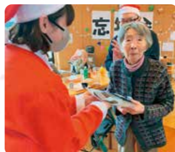
サンタさんからのプレゼント